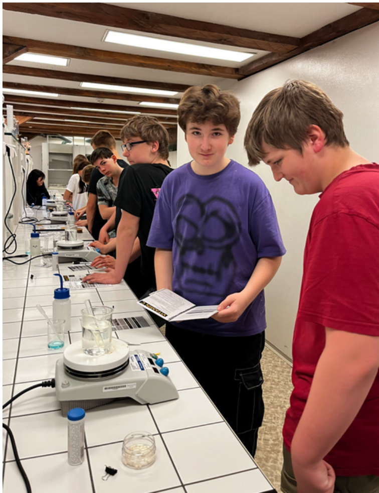
Zapálený tým vědců