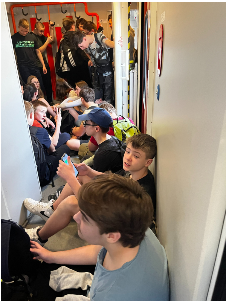
Nakonec jsme se do vlaku všichni vešli