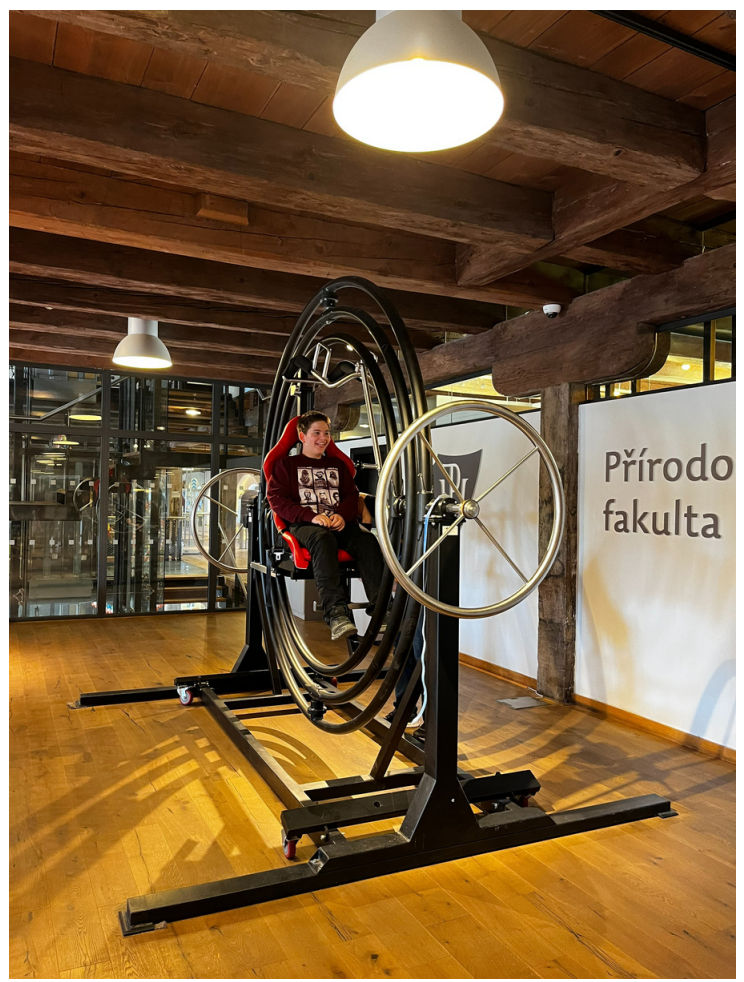
Odvážlivec na gyroskopu