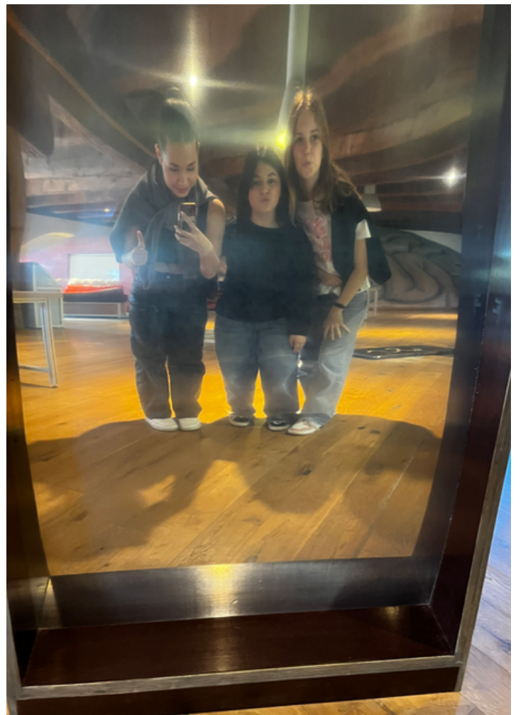
S vypouklými zrcadly je vždy zábava