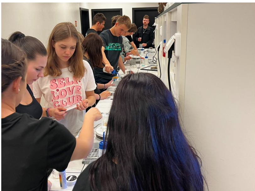
Společné bádání v laboratoři

Následně navštívili v muzeu expozici „Rozum v hrsti“, ve které mohli vyzkoušet různé hlavolamy, prozkoumat zvětšený model mozku a otestovat gyroskop.